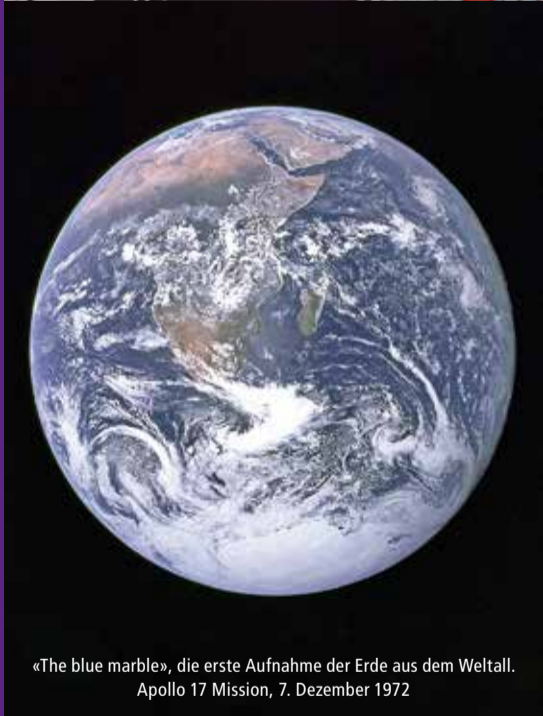
«The blue marble», die erste Aufnahme der Erde aus dem Weltall. Apollo 17 Mission, 7. Dezember 1972

Mittwoch, 17. April 2019, 19.30 Uhr, Pfarreiheim Egolzwil-Wauwil